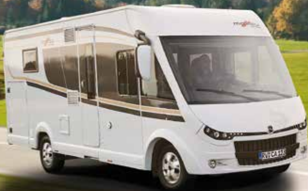
Basisfahrzeug Fiat Ducato Flachrahmen